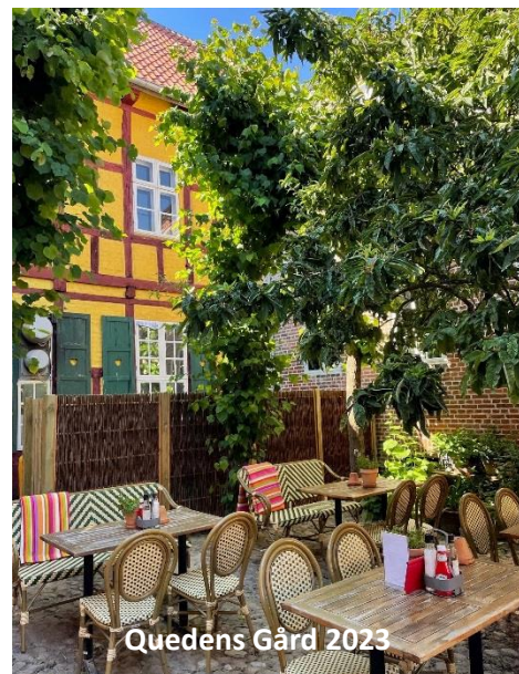
Quedens Gård 2023